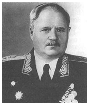
Болдин И. В. командарм Великой Отечественной войны, генерал-полковник