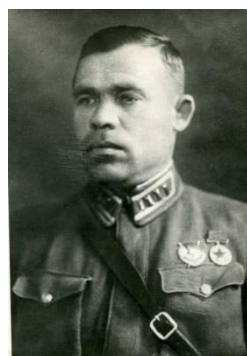
Мухин Г. В. советский военный деятель, генерал-майор